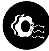
Belüftungsventil für Druckausgleich